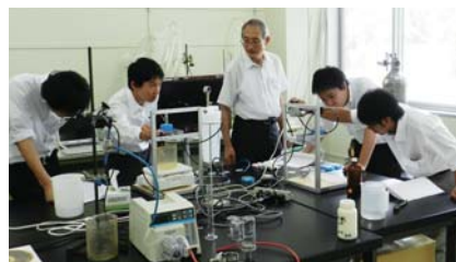
横浜「精密ろ過膜の細孔径とろ過特性」