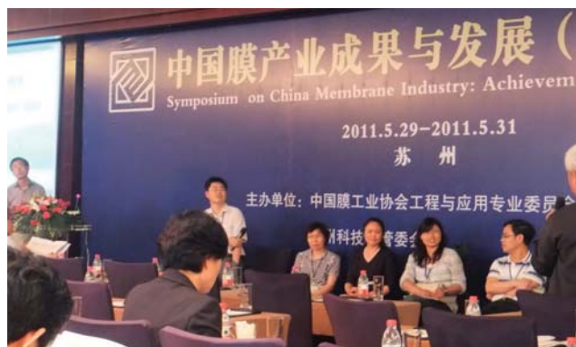
中国膜产业成果与发展(苏州)研讨会