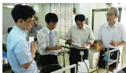
大阪「精密ろ過膜の細孔径とろ過特性」