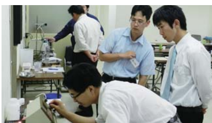
大阪「濾紙の構造とろ過特性」