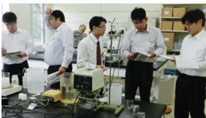
横浜「濾紙の構造とろ過特性」

限外ろ過膜(アルファラバル製)により分子量が異なる物質の分離を行い、分離特性を確認する。限外ろ過の分離特性と実際の応用例を紹介する。