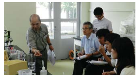
横浜「限外ろ過膜の分離特性」